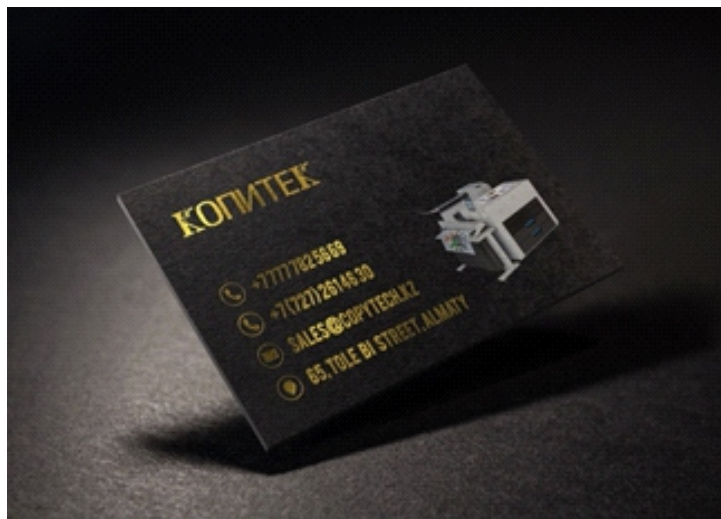
Золотой тонер-картридж меняет черный.