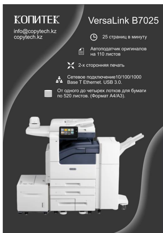
Белый тонер-картридж меняет голубой.